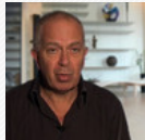
Sexualité: les grandes ...