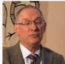
Sexualité: tabous ou ...